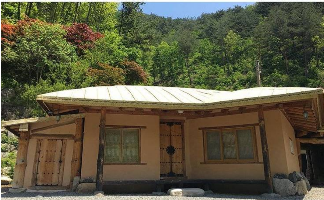
대티골로 떠나는 시골여행