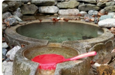
입구에서 물 한잔 하세요